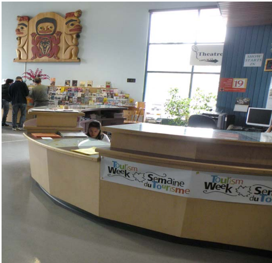
שילוב עמדה גבוהה ונמוכה. גישה מהצד לאדם בכיסא גלגלים.